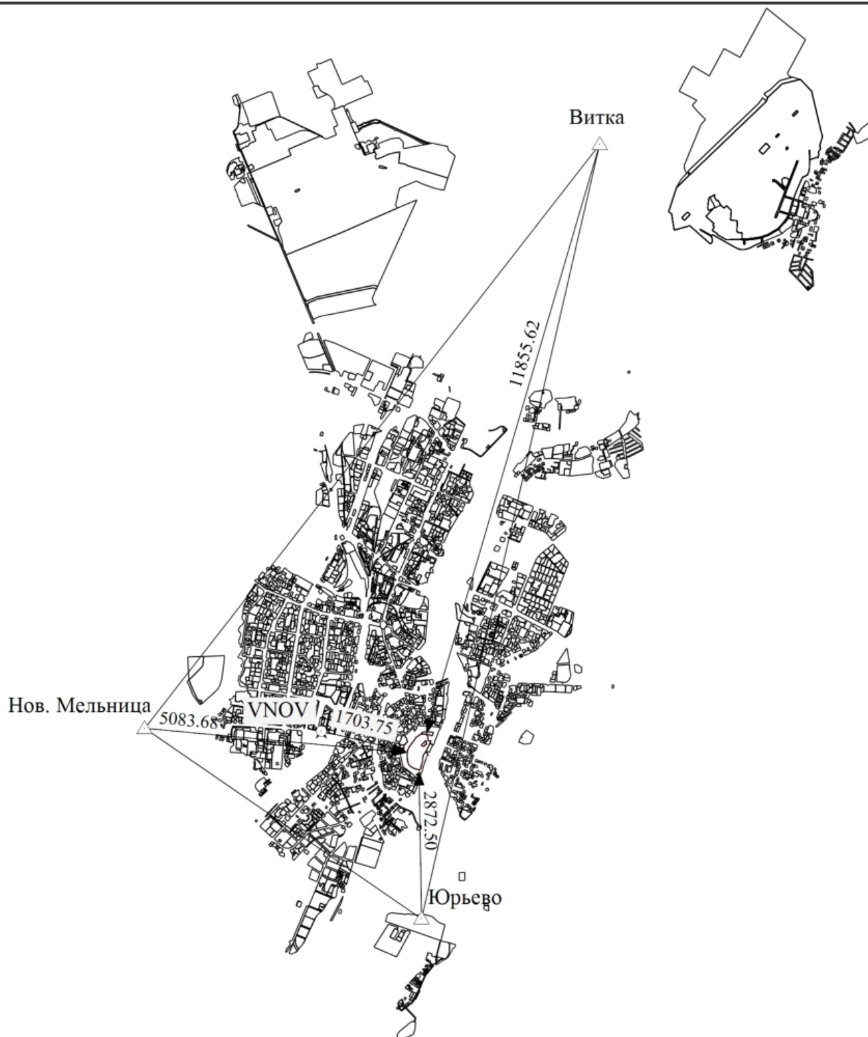
Схема геодезических построений